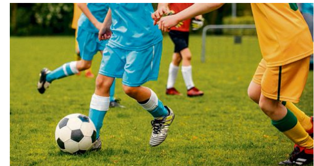
Près de 5000 jeunes se sont affrontés à la fin du mois de juin.

Le séjour devait faire office de cadeau souvenir... Son report brutal sera à coup sûr inoubliable. Cet été, 5000 petits footballeurs âgés de 6 à 12 ans étaient invités à Europa-Park par le tournoi cantonal de juniors Sekulic, qui s'est déroulé cette année à Planfayon, à la fin juin. Cette récompense, comprenant transport et billet d'entrée, était offerte à tous les participants. Leurs éventuels accompagnants devaient, eux, payer 100 francs. Mais l'opéra-