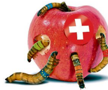
Le visuel controversé montre des vers dévorant une pomme.